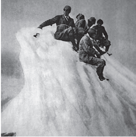
Auf dem Gipfel des Matterhorns am 28. August 1908. Prinz Albert I. links im Bild.