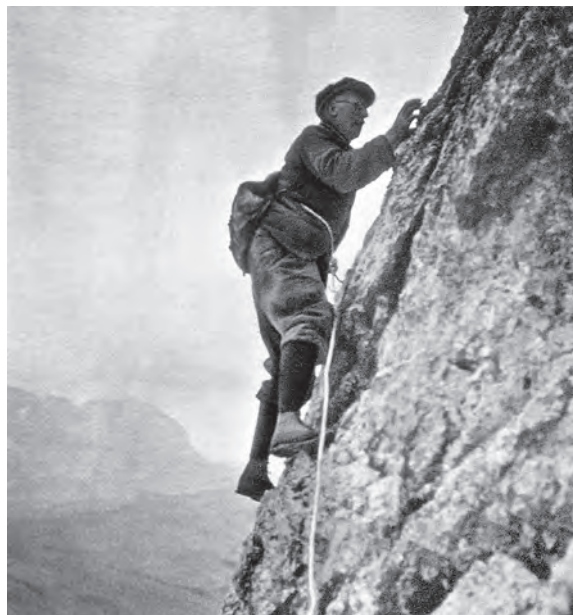
Der 56-jährige König als Seilerster in der Nordwand der Punta Santner (2414 m) in den Dolomiten am 8. September 1931.