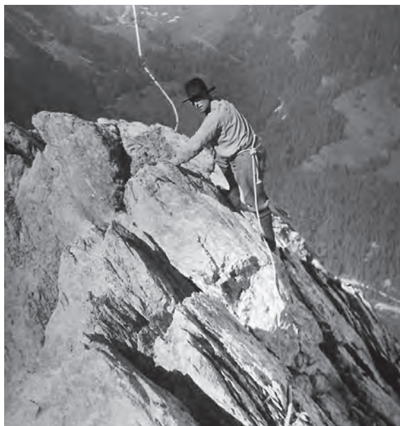
Der Roi alpiniste an der Tannenspitze in den Engelhörnern am 30. September 1930. Die Engelhörner, auch als «Dolomiten des Berner Oberlandes» bekannt, liegen nicht weit weg vom Landsitz Haslihorn am Vierwaldstättersee, einst die Sommerresidenz der belgischen Königsfamilie.

Der Vorschlag erfuhr «überall grösste Zustimmung» und der Fonds sei gegründet worden, meldete Amstutz bereits im Mai-Heft. In einer ersten Kollekte seien «rund Sfr. 8000.– der Kasse übergeben worden», erinnerte sich der Gründer 1993. Es gab einen Postkartenverkauf und ein Benefizkonzert der US-amerikanischen Opernsängerin Rosa Ponselle im