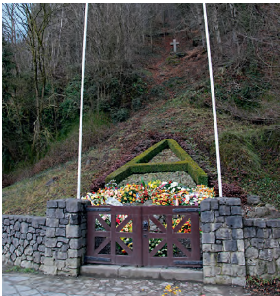
Marche-les-Dames bei Namur: Denkmal für König Albert I. Das Kreuz markiert die Stelle, wo man den toten König am 18. Februar 1934 um zwei Uhr morgens fand. Aufnahme vom 18. Februar 2009, einen Tag nach den Feierlichkeiten zum 75. Todestag.